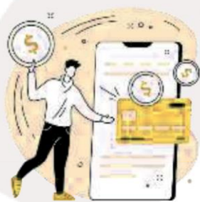
Seus Hábitos de Consumo