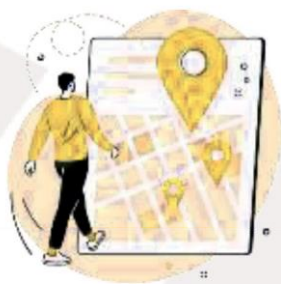
Seus Hábitos de Deslocamento