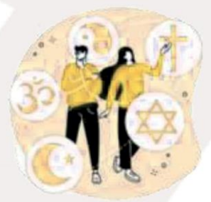
Sua Preferência Religiosa

Agora fica fácil você compreender que o uso mal intencionado desses dados pode criar muitos problemas, como ocorre com os conhecidos golpes de boletos bancários, fraudes em contas de aplicativos, abertura indevida de contas bancárias e de consumo